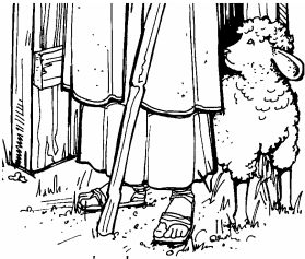
El pastor llama a sus ovejas por su nombre